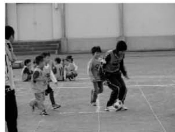
横浜FCの選手によるサッカー教室(八景小・川上北小)

放課後キッズクラブは、従来の学童保育とはまっ子ふれあいスクールを合わせたような活動で、遊びの場と生活の場を提供している。はまっ子ふれあいスクールよりもスタッフの数が充実している。(17時以降は学童のように保護者負担でおやつを提供している。)