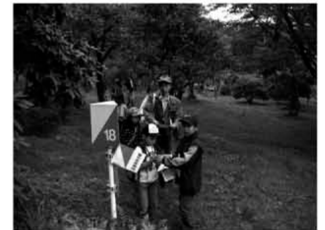
五泉市「のびのび学習教室」のレクリエーション活動の様子

事前の保険登録は全校生徒がしており、参加したい日は直接放課後教室の受付にカードを提出することで、活動に参加することができる。活動の内容は、トランプ、お手玉、ピアノ練習、ビーズ手芸、お絵かき、バドミントン、ドッジボール、バスケットボール、キックベース、大縄跳び、一輪車、おにごっこなど、子どもたちが自由に遊びを選び、自由に過ごしている。宿題も子どもが必要とあれば、スタッフが教えたり手伝ったりもしている。