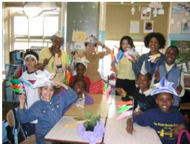
NYdV という NPO の HPI に紹介されているニューヨーク市が運営するアフタースクールプログラムの「日本文化紹介プログラム」の風景

こうした動きは21世紀入って全米に広がりをはじめました。米国のハーバード大学ではこうした「放課後」を研究テーマとした講座が設置され、学校から教育を見るのではなく、地域から教育を考え、地域社会との関係で研究が進められています。特に、青少年犯罪の危険性の増加、女性の社会進出とした社会状況の変化を受けて、アフタースクールは新たな教育の場として注目され、各地で大きな成果を収めていることが報告されています。そうした中、国も「国立放課後研究所」を設置し、全米の放課後に関する情報を収集しています。