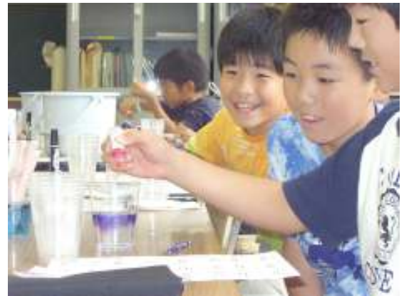
放課後の科学実験活動に取り組む子どもたち

この活動を行った埼玉県さいたま市（旧大宮市地区）では、文部科学省からの2つの事業が終了した今でも、英会話活動や科学実験活動がさいたま市の公民館事業として継続されており、多くの子どもたちの土曜日の活動として定着しています。今回の放課後活動のプログラムはそうした活動の中で、実績を積んできたものですから、「小学校高学年の参加率向上」ということについての「放課後活動プログラム開発」は自信がありました。