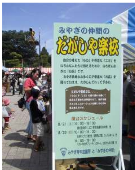
駄菓子屋的機能を地域社会に取り戻すために、全国各地で開かれている「だがしや楽校」

こうした基本的な放課後のイメージを基に保育のあり方や放課後活動のあり方が考えられていくことが大切だと思います。そして、そのためには現在の学童保育の改革も必要です。学童保育にかかわっている方は「留守家庭」に対する支援ということを盛んに言われますが、留守家庭でなくても、