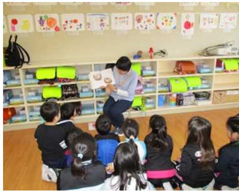
図書ボランティアによる本の 読み聞かせ活動