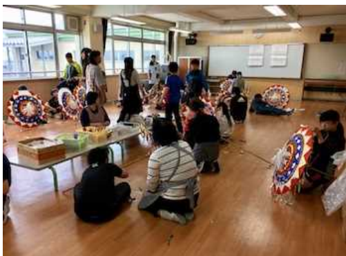
で生徒とボランティアの皆さん 傘修理体験活動

小学校が実施する放課後における補足的な学習を支援するため、退職教員等の専門的ボランティアを小学校に派遣する「放課後学習サポート」を実施している。毎週1回を基本とし個々の、児童の学習のつまづきを解消するなど、きめ細やかな指導を行っている。