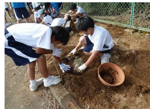
自ら育てた苗木を地域に植栽する活動