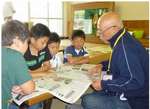
登校後の時間を活用した新聞の読み聞かせ活動

日本文化を学ぶ活動として、茶道体験や和太鼓体験、和箏体験や昔遊び体験、そろばん学習、浴衣着付け体験等を実施。さらに、登校後の時間を使った新聞を通じた交流活動や、家庭教育支援活動と連携し、次年度入学児童の保護者の家庭教育講座受講中に児童対象で行ったボディ・パーカッション活動等もある。