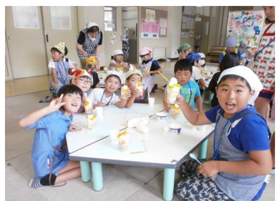
で縦割り調理実習(調理実習をすることで調理実習をすること)