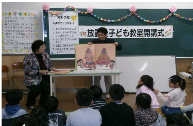
て読み聞かせの様子(団体による)

地域の関係団体の協力を得て、「読み聞かせ」や「料理教室」などを実施し、子供たちに豊かな体験活動を提供し、活動の充実を図っている。