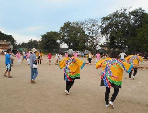
地域の 交流の 場とな った おの のふれ あいま つり