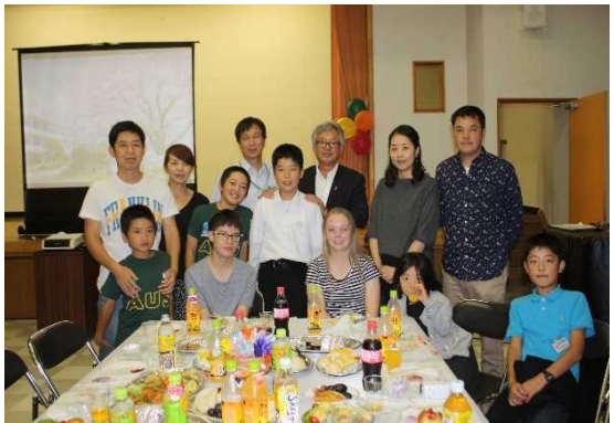
地域の 方々の チーム の手 料理 でも な

・他にも地域学校協働活動として、地域の方が中心となった読み聞かせボランティアや歩く会ボランティア、クリーン作戦ボランティア、学習ボランティア等があり、児童生徒のために様々な支援活動を実施している。