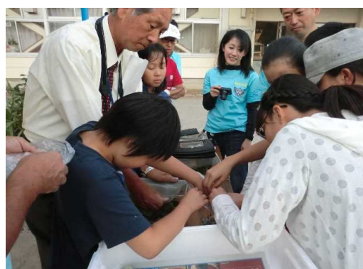
ルのホ を方 タ 間 々 ル 近 で 見 オ 会 せ て い プ た に 放 だ 放 い す た ホ イ 。タ