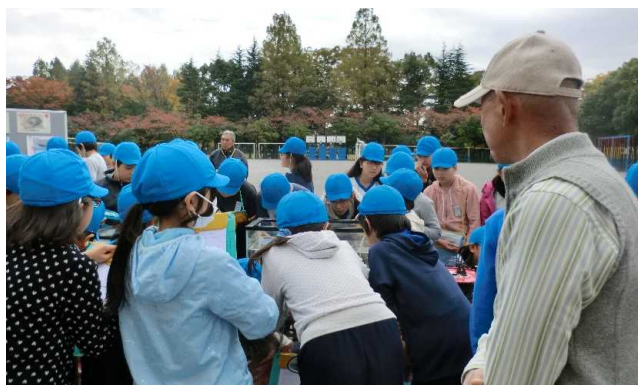
いたに鴨年 たに川生 だいを いるを た生総 。きす 。きす 物的 に合 なつ つー学 の習 て方 の教 々々 えに 間 で鴨

本校は、平成28年度彩の国埼玉環境大賞において奨励賞を受賞、また、全国学校・園庭ピオトープコンクール2017にて日本生態系協会賞を受賞している。