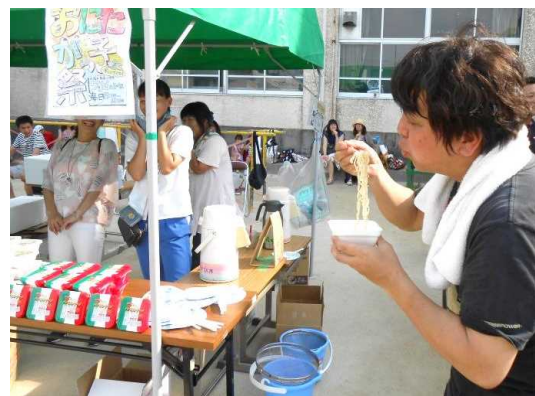
地域学校協働本部として地域の祭りに出店して協働活動推進員が地域の