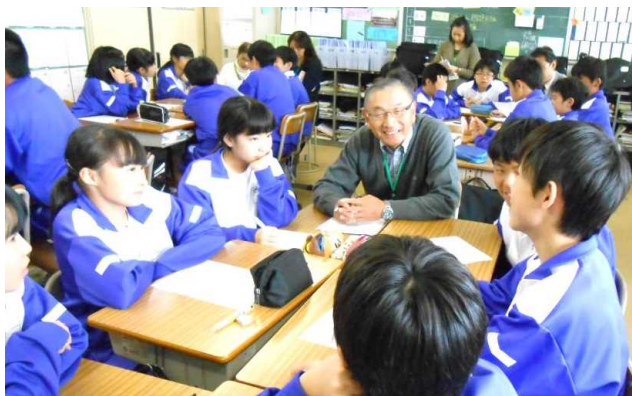
「道徳実践講座」で生徒協働活動推進員と談笑する統括的な地域学校

琵琶・虚無僧体験(鬼高小)、教職員向けの研修サポート(鬼高小)、地域の祭りに出店、保育交流(中・家庭科)引率、花壇整備