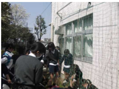
地域の生徒・保護者・地域のボランティアの指導による花壇整備活動の様子。

英検応援講座は主にパソコン室で実施している。インターネットの動画サイトを視聴することにより、より一層ネイティブの発音に触れることができ、受講者には好評である。また、講義もプレゼンテーションソフトを利用して行われており、繰り返し復習する際に有効である。