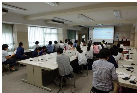
本校の生徒・保護者・地域のボランティアの指導による「英検応援講座」の様子。