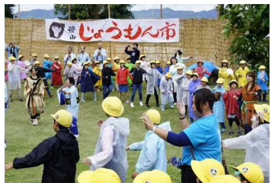
練「笹山じょうもん市」の音頭ときり。大の坂、天神ばや縄文