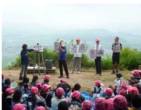
井業「やまて十日町市中条交流大会」の地を学習

○やまて十日町市中条交流実施にあたって、保護者や協賛団体などで設立した「虹の会」が資金援助や人的協力活動を行っている。「中条ちんころ伝承会」は、十日町市の冬の風物詩であるちんころの販売収益のほとんどを寄付してこの事業を支え、地域の民俗文化の継承にも貢献している。