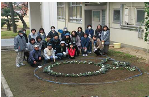
ひまわりの会を中心とした環境整備活動

地域・家庭・学校がそれぞれ子供たちのために、協力し合うことでより深い協働活動を行っている。