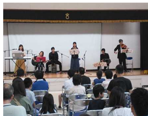
おとんの会が行った親子音楽会を招いて行った企画で、演奏家を