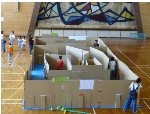
に児童館フェスタ（3館合同）における段ボール迷路

3児童館合同で「児童館フェスタ」を行った。段ボール迷路は地域の方の協力のもと完成し子供たちは存分に楽しんでいた。子供の居場所づくりは、毎週水曜日に教員OBや地域の方が「ふれあい塾」「わくわく塾」を開催している。学習支援を中心に行い、時にはふれあい活動も行っている。