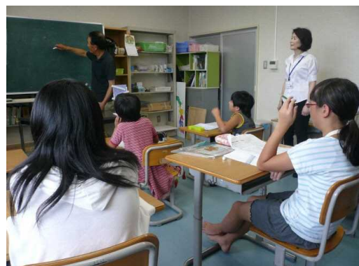
の「ふれあい塾」での学習支援の様子