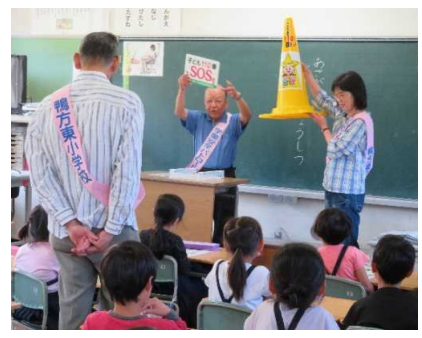
アサガク防犯教室(1年生)