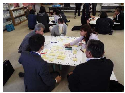
地域みんなで子供の未来を考

○教職員・PTA役員・地域住民による熟議。育てたい子供の姿や課題を共有し、ビジョン実現のためにアイデア出しをしている。 ○見守りパトロールの方が、1年生対象に年4回、朝学習の時間に防犯教室を実施している。