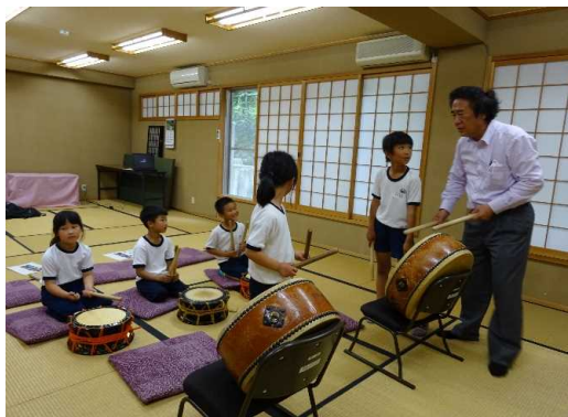
り地域の方から松尾神社の秋祭り太鼓を学ぶ

・地域文化や郷土芸能を地域住民の方々から学習する。発表会は町の文化財や公民館など、地域の人が身近に行き来できる施設で毎年行っている。