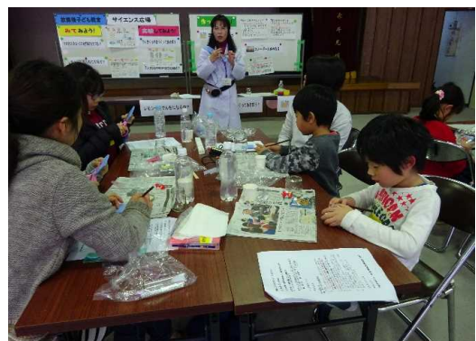
者いろいろな実践を友達や保護者(教室協力)して行う(サイエン)