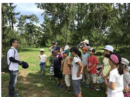
松林に詳しい方の自然学習を招いて

平日のつやざきアンビシャス広場には、お母さんと乳幼児も参加。休日は、月に1～2回、地元の自然環境や人材を活用した様々な体験活動を行っている。