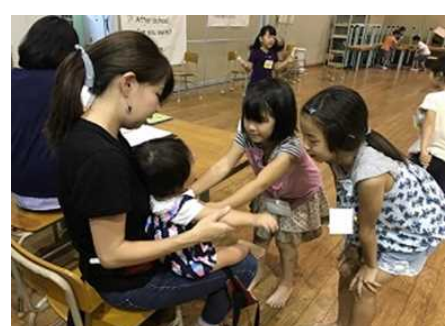
放課後の居場所―乳幼児との出会いも楽しい時間―