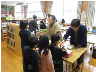
会大好評だった新春福引き