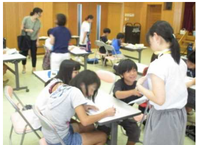
のサマースクール(夏休みの補習活動)