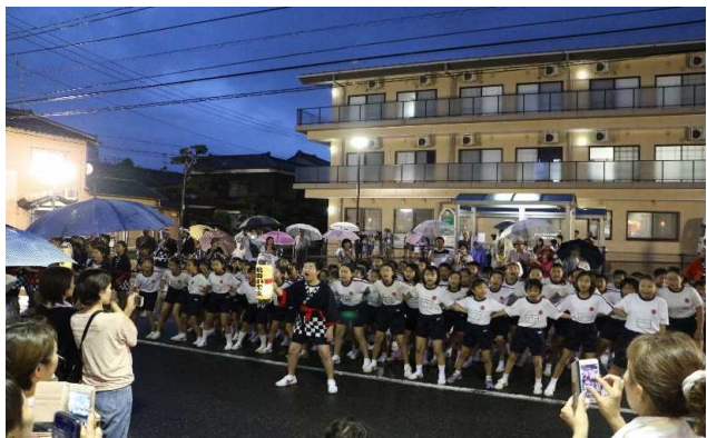
高な亀田祭りにも歌う「亀田木遣り」を打たれ

○企業との連携:(株)長谷友が米の消費拡大をねらって開発を進める「米ピュール」の可能性を5年生が社会科の学習と関連付けて学ぶ。また、亀田綿応援隊が商品開発を進める「亀田綿」について、3年生が綿の栽培、糸繰りの仕方等について体験的に学ぶ。