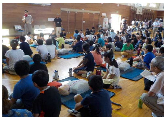
職員子供型員合(約八〇)防災訓練を行う地域住民による