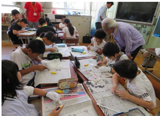
総合的な学習の時間における「竹」の活用

土曜学習として「大正琴教室」「休日地域児童クラブ グランドゴルフ」を毎月開催しているほかにも、地域と協働した多様な取組を行っている。