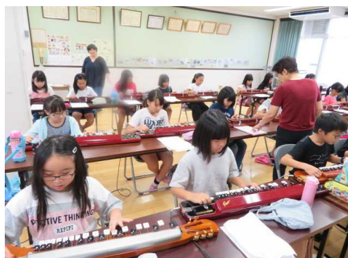
土曜学習における「大正琴教室」