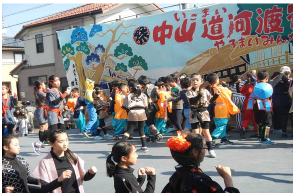
自地域の方々の行事「河渡祭」に小学生も参加し、地域の歴史を学び、

・学習支援は、生活科1年生「昔の遊び」・2年生「町探検」、3年生算数「そろばん」・図画工作「木工工作」、4年生社会科「水防団の活動」、6年生家庭科「ミシン」学習の講師・支援ボランティアの他、クラブ講師、読み聞かせボランティア、「夏の寺子屋」指導を行っている。