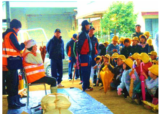
のし自治会主催の地域合同自主防災訓練を実施