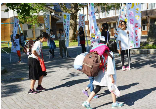
朝、街頭や学校前でのぼり旗を掲げ、地域の方々と一緒にあいさつ運動