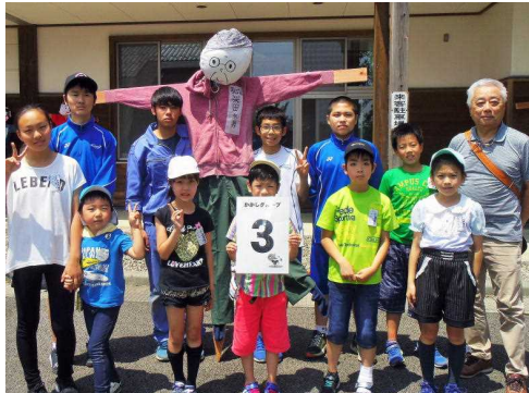
小学校前庭に幼児・小・中・高の地域住民等、約六百名が集まりかかし製作

本地域は、旧西目町時代から「小さな町の大きな文化」を掲げ、文教施策が盛んな地域であった。その伝統が今でも地域の方々の学校に対する協力に反映されている。地域学校協働活動を通して、より一層の地域連携を図ることで、地域を愛し、地域に愛される学校づくりを実践していきたい。