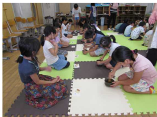
地域ボランティアによる抹茶体験