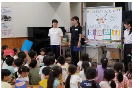
による文字学食育園女子大学学生