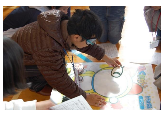
「生留左は学生・外国が福笑いなど「い教上・挑え下ます」。小学