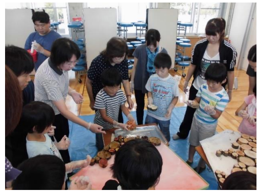
「金津の森」の木を組み合わせてテーブルづくり。カー付きのテセーブルづくり。

クラブ活動に地元企業から社員を派遣してもらいプログラミングの指導を受けている。6年生のキャリア教育では宇ノ気小学校と合同で、さまざまな職種の方の話を聞く機会を設けている。「畑の先生」や「お米の先生」を招待し、野菜パーティーなどで感謝の会等交流を深めている。