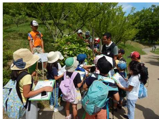
精華まなび体験教室(自然体)