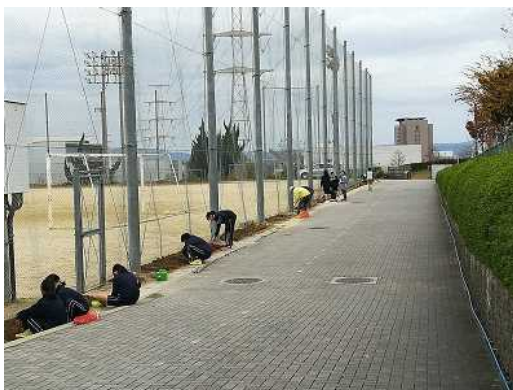
花壇の植え替え(環境整備)

地域住民等の連携・協働により、学校の環境整備や見守り活動を通した安心・安全の確保、子どもたちのための体験活動機会の充実など、具体的な活動が進んできている。