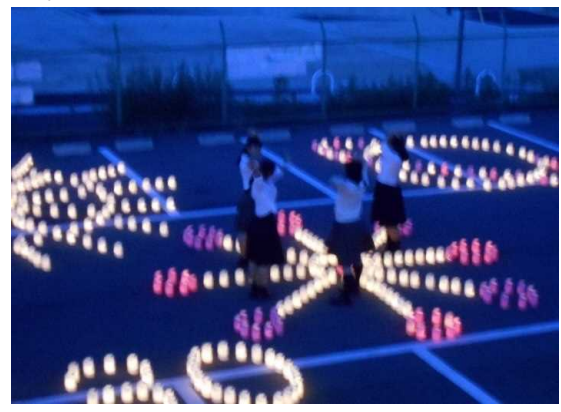
たんぼぼの家と連携した会 校庭での出張燈花会