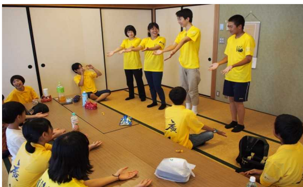
（リーダー子どもたちとの交流会）

社会福祉協議会と連携し、赤い羽根共同募金を行った。また、地域のショッピングモール(サンシャイン加計店)や町役場と連携して、災害被災者支援募金や赤い羽根募金、リサイクル活動、ボランティア活動を実施している。