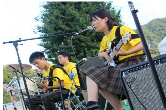
（地域の祭りでの部活動の発表（コンサート））