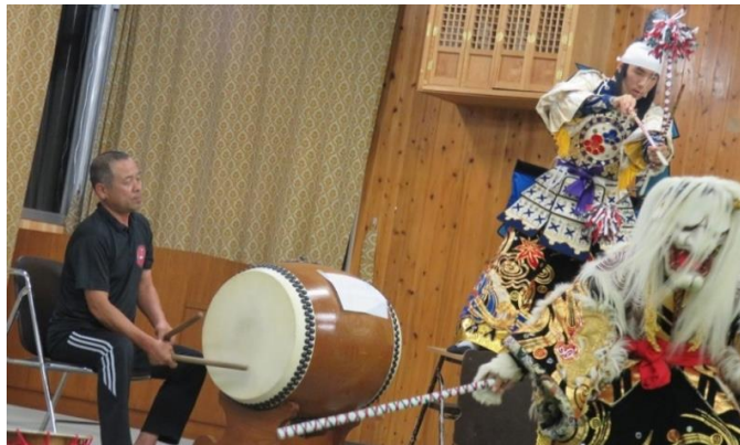
「地域の方から伝統芸能を学んでいる様子」

連携先：北広島町立芸北つし保育園、さつきヶ丘保育園、北広島町立芸北小学校、北広島町立芸北中学校、中央大学ビジネススクール、北広島町農山村体験推進協議会、北広島町役場、一般社団法人 芸北道場、認定NPO法人西中国山地自然史研究会