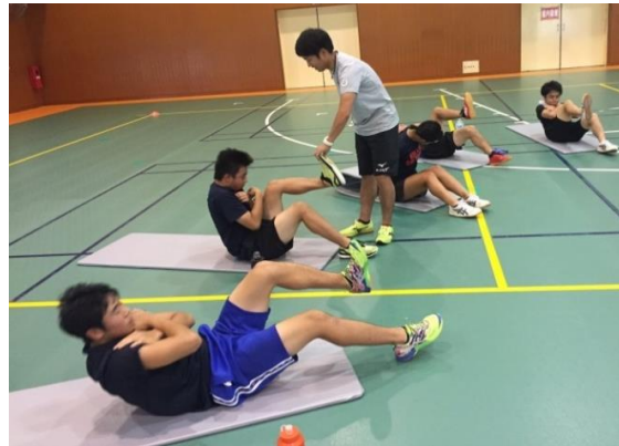
部活動支援「競技スキー」の様子