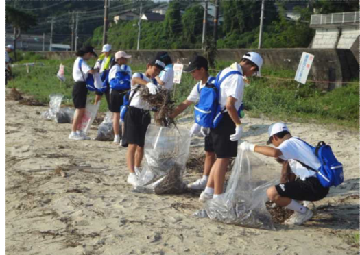
超地域の中学生が参加に200名を