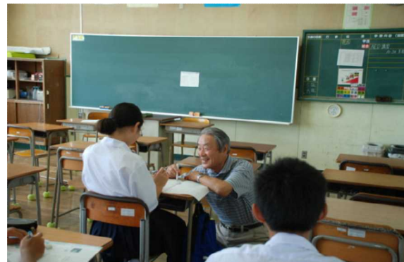
地域住民の休業中のボランティアによる長期住居の学習支援

本ネットの大きなねらいは「あらゆる面から地区の学校づくりを応援すること」と「ネットでの活動を通して地域づくりを推進すること」の2つである。「学習支援」などの学校支援活動と地域の海岸清掃などの地域貢献活動を企業・団体とも連携・協働しながら、一体となって推進することで、「学校づくり」、「地域づくり」をさらに進めていく。