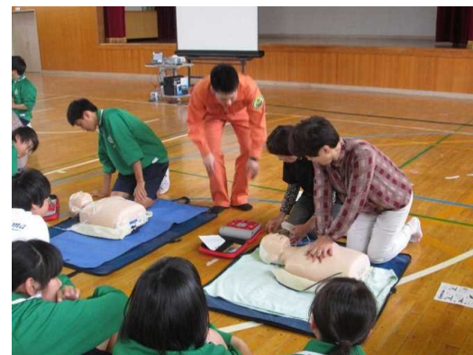
け地救 域命 の方救 々が急 なら々 らと・A 学中ED ぶ生講習 姿が共 に助