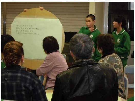
合生認 徒徒知 いを・症 元地サ に域ポ グ・ー ル専ー プ家養 発の成 表の講 し話し

連携先:NPO森の会,南浜病院,エミタイ,北地区歴史文化研究会,北区社会福祉協議会,包括支援センター,新潟商工会議所,いなほ会,新潟太陽福祉会,アルビレックス新潟等。新潟医療福祉大学生ボランティア,敬和学園高校生徒との交流も行っている。