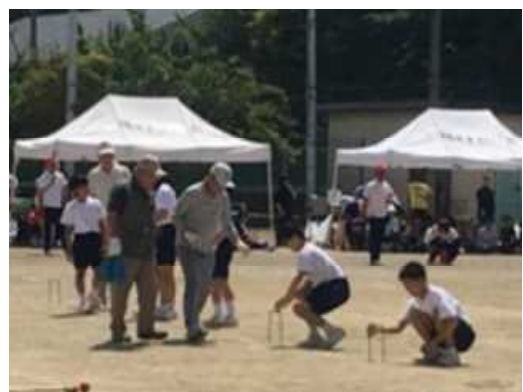
地域の運動会（ゲートボール）で中学生がボランティアとして参加