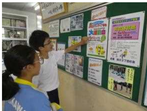
校内ポスターでボランティアを募集