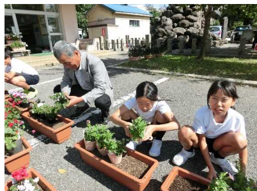
環境整備 活動 (花植え)