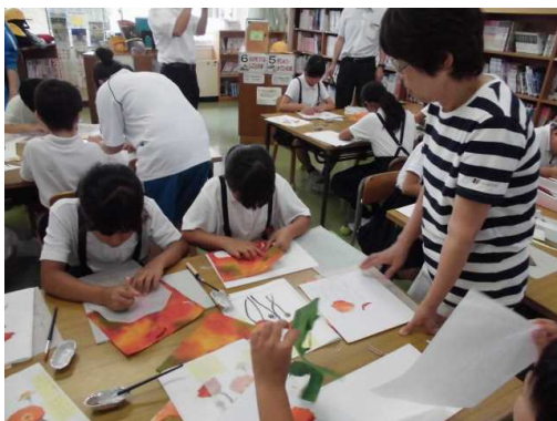
地域先生による土曜授業 (アートフラワー教室)