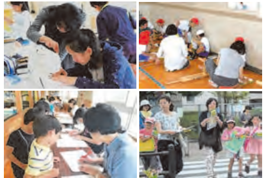
保護者との連携協働活動 (家庭科学習支援・丸付け先生 体力テスト支援・校外学習補助)