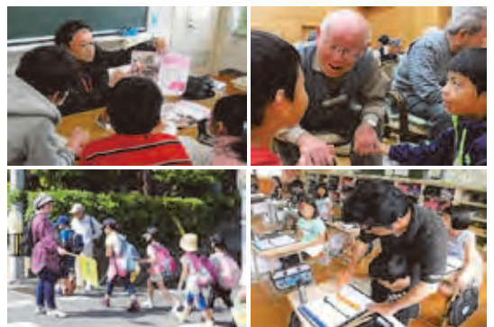
地域住民との連携協働活動 (キャリア教育・歓迎遠足 高齢者との交流・書写指導)