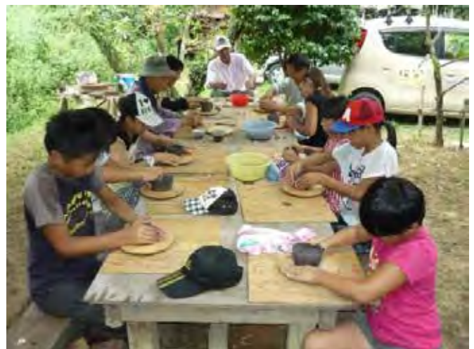
体験学習（陶芸）の様子