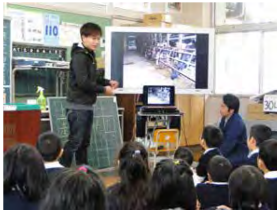
JA 田島青壮年部による「食」の授業（低学年）