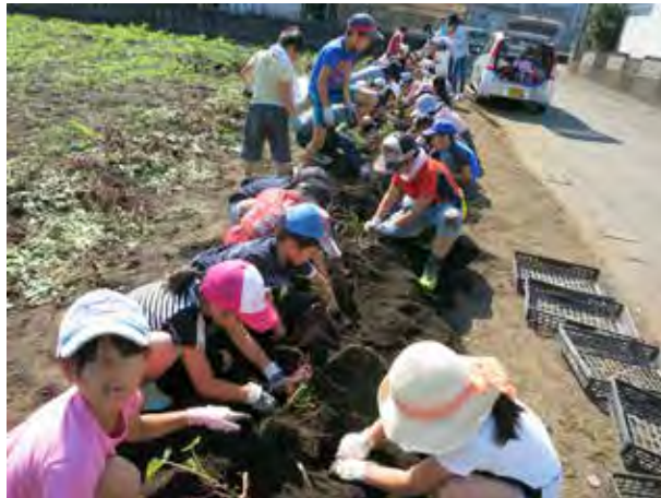
苗から育てたさつまいもの収穫

「みんなでしゅくだいがおわったあと、木のぼりやなわとびをしたことが、とてもたのしかったです。ならいごとで、さんかできないときもありましたが、さんかできたときは、とてもたのしかったです。」（祝吉小学校 2年生）