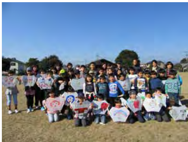
たこを作って遊ぼう