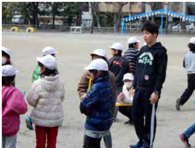
昼休みの見守り活動