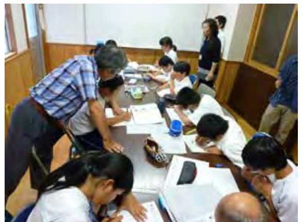
夏休みの学習支援