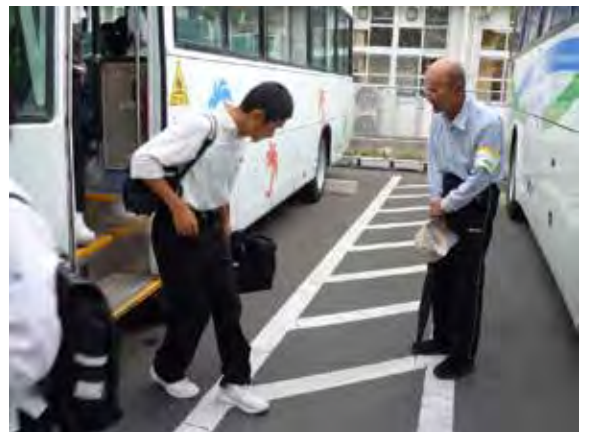
通学バスへの支援