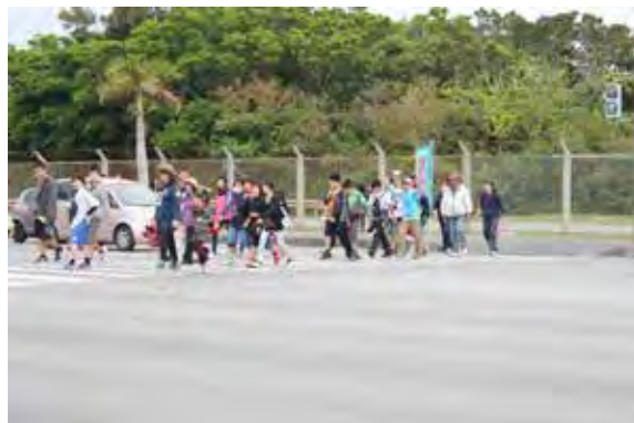
子ども会と連携・協働した「根性ウォーク」