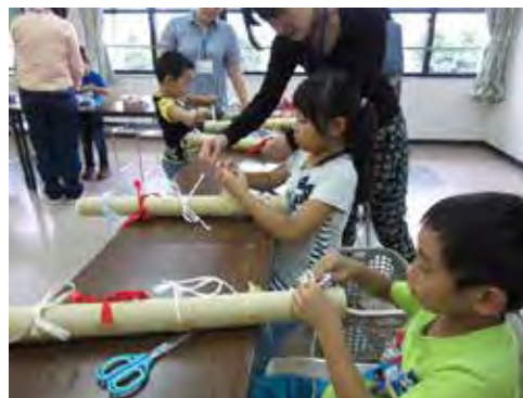
放課後子ども教室「脳トレ」

台風などの自然災害やインフルエンザの流行による緊急時には、保護者への連絡・調整の手段としてLINEの連絡網を活用している。