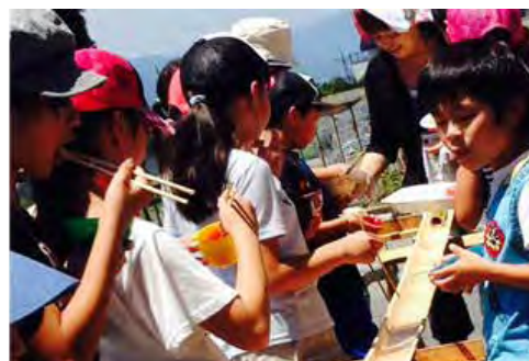
親子体験教室「そうめん流し」