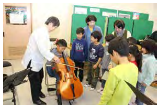
音楽鑑賞でのふれあい