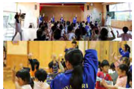
「総おどりプロジェクト」 総おどり園児バージョンを園児に教える活動