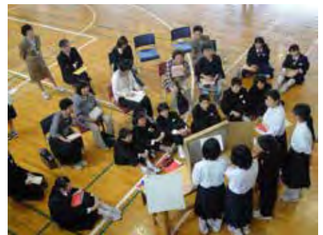
「食育プロジェクト」 地域の方々に向けた紙芝居発表