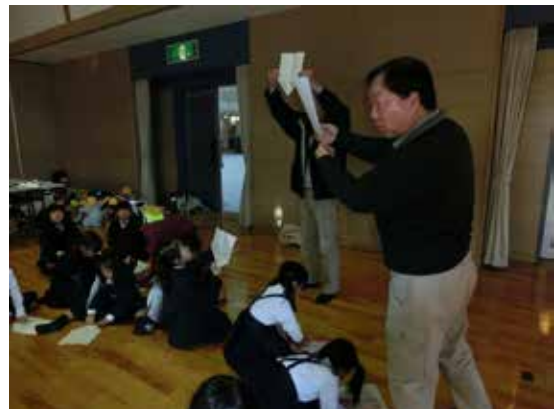
昔遊び（紙飛行機作り）