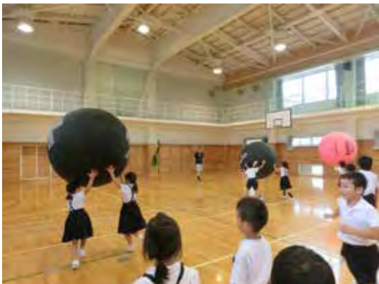
キンボール・スポーツ教室

学習支援は、プログラム終了後に時間が余った場合、帰宅まで宿題に取り組むなどの学習の時間を設けている。