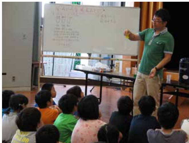
わくわく科学教室の様子