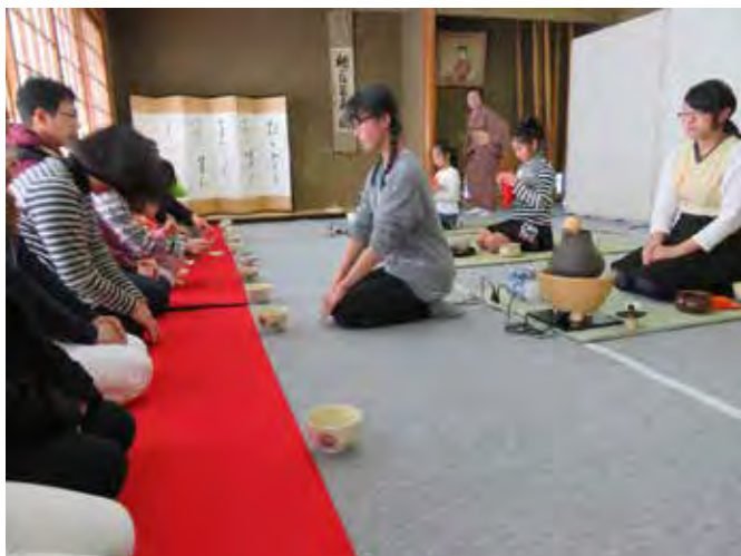
伝統文化子ども教室 合同発表会