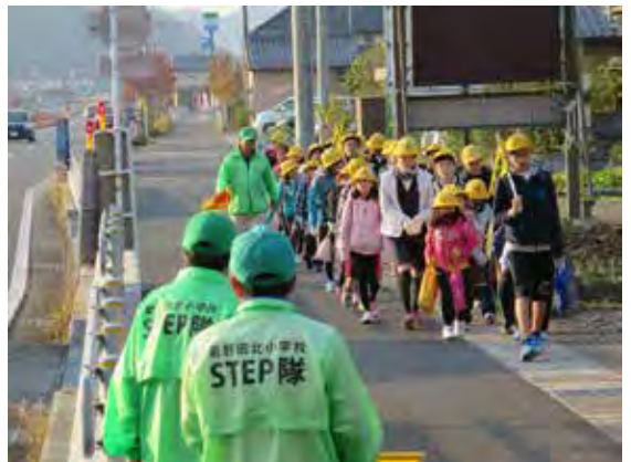
毎日集合時から校門まで、五十の通学班を見守りながら同行する登下校。

コミュニティ・スクールの安全・安心支援活動を応援するため、各種団体の協力により、下校時等に青色パトロールカーによる巡回活動も行われるようになった。学校職員も警察の実施する講習に参加して資格を取得し、地域一体となった活動を展開している。