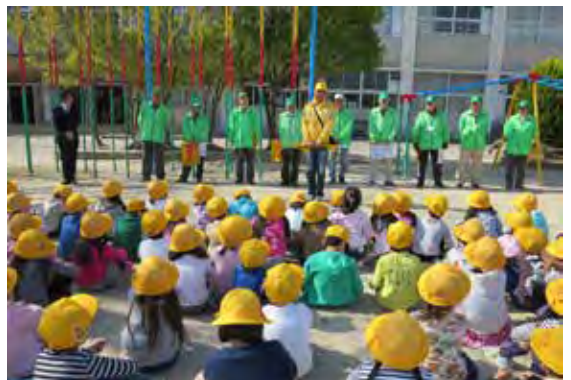
園バスや自家用車による送迎から、自分の足で長い距離を歩いて登校ようになった一年生対象の道路の歩き方訓練。