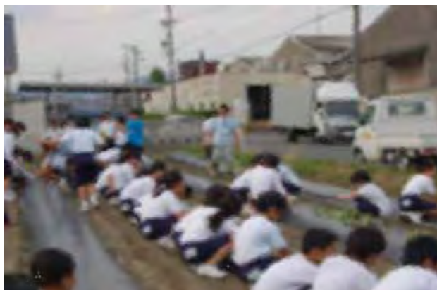
全員参加、サツマイモの苗植え