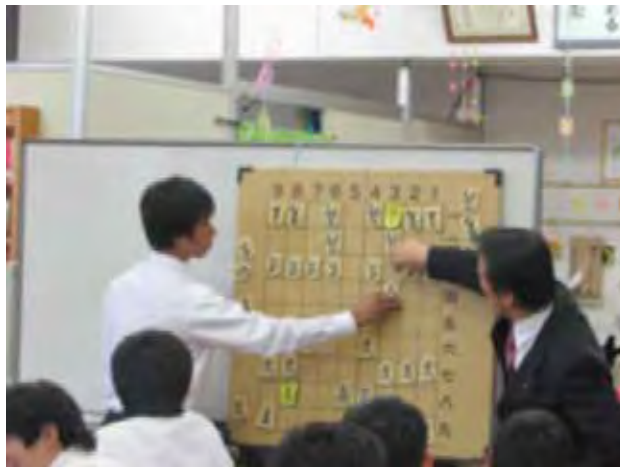
地域の方から将棋を学ぶ （ふれあい講座）

地域住民にとっても、学校支援ボランティア活動をとおして新たな人間関係を構築することができ、地域住民の連携・協働が弱いという地域の課題克服にもつながっている。