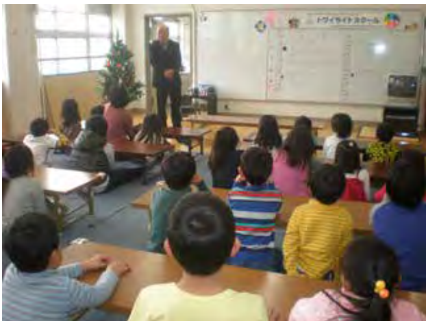
講座「なかま」での人権学習

地域の団体が主催する行事に参加するために、地域の方が講師となり、子供たちは事前の準備から進んで参加している。地域の方、保護者や運営スタッフからいつも温かく接していただいていることにより、「自分は大切な存在なんだ。そして、役立つ存在なんだ」という自己肯定感が育っている。こうした活動を継続的に行ってきたことにより、子供に自主性・社会性・創造性が育つとともに、子供を中心として、地域と学校と保護者の絆が深まっている。