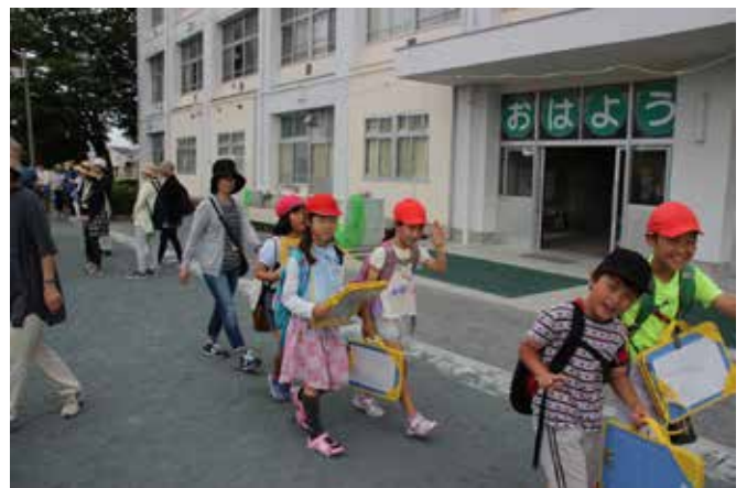
三年生の学区探検に引率するボランティア