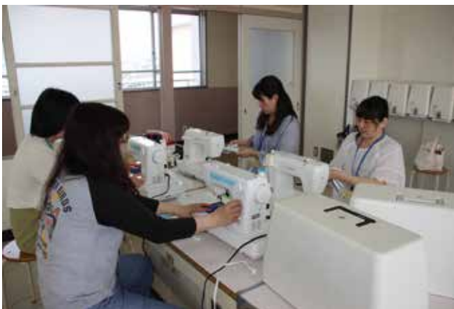
五年生のミシンの授業を前にミシンの調整をするボランティア