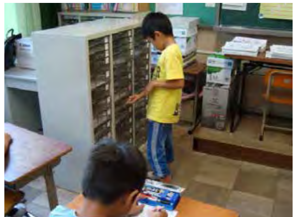
学習用プリントを選ぶ児童