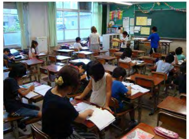
放課後まなび教室での学習