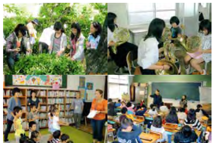
活動例（茶摘み、英会話、そろばん等）