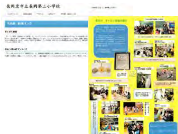
長岡第三小学校 HP にて活動紹介の様子