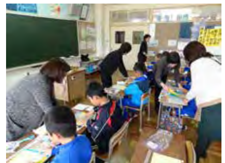
ふれあい教室（ちぎり絵）の様子