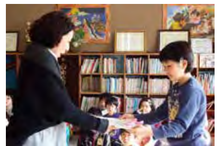
日頃お世話になっているボランティアへ感謝状の贈呈