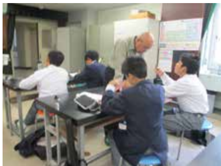
地域の方等を学習支援者とした放課後学習会

公民館祭りや町内会の親睦餅つき大会等、18の地域行事に計387人の生徒が参加しており、地域の方々とともに活動を通じて、地域活性化を推進した。